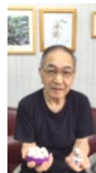
両手に地蔵さん。充実の顔!

問「材料の小石は？」答「小石は、市販のものを購入して、それにサインペンで心を込めて描きます」【取材を終えて】地蔵さんの表情は、どれもやさしく穏や。「希望される方には差し上げています。材料があるうちは作り続けます」と石水さん。穏やかな人柄が伝わってきました。(小川)