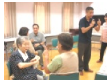
楽しく和やかに学ぶ

8月24日(木)「手話教室」が行われた。参加者(15名)は、教わった手話で、自己紹介やゲームを楽しみました。