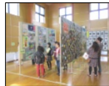
写真=昨年のあけい祭の一コマ