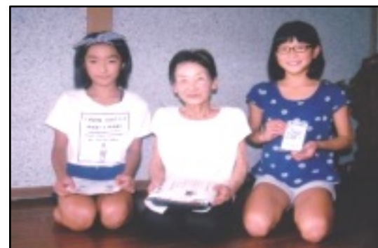
ボランティア体験する子供たち

参加した児童の感想 「届けたら、「ありがとう」と言ってもらったので、うれしかった」 「『暑さに負けずに過ごしてください』と言ったら、「ありがとう」と言われました。私も暑さに負けずに頑張りたいと思います」 「おばあちゃんに「がんばってね」と言われたことがうれしかった。」