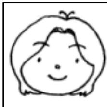
自画像のイラストで～す。

上井公民館と合築となつてから11年目を迎えました。上井児童センターには、「自由来館」と「児童保育(ポプラ学級)」があります。