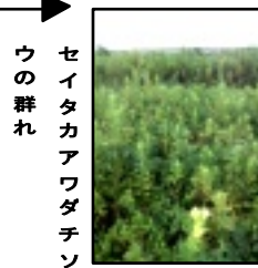
ウの群れ セイタカアワダチソウ

初秋早朝の川原はこちち良い。新田橋の下、川原近くの散歩道、500mほどを歩く。道の側にはススキの大群生が連なり、道の片側ではセイタカアワダチソウが群生していた。