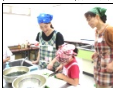
初めて?包丁使って野菜切り